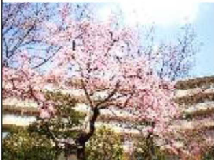
中庭に咲き誇るしだれ桜。

さて一口に介護付きホームといっても、立地・居室・共用スペースなどのハード面、生活・食事・健康管理・介護などのソフト面いずれも実に多様です。皆様もどのように選択すれば良いか迷われるはずです。そこで私見ではありますが、ポイントをいくつかご紹介いたします。